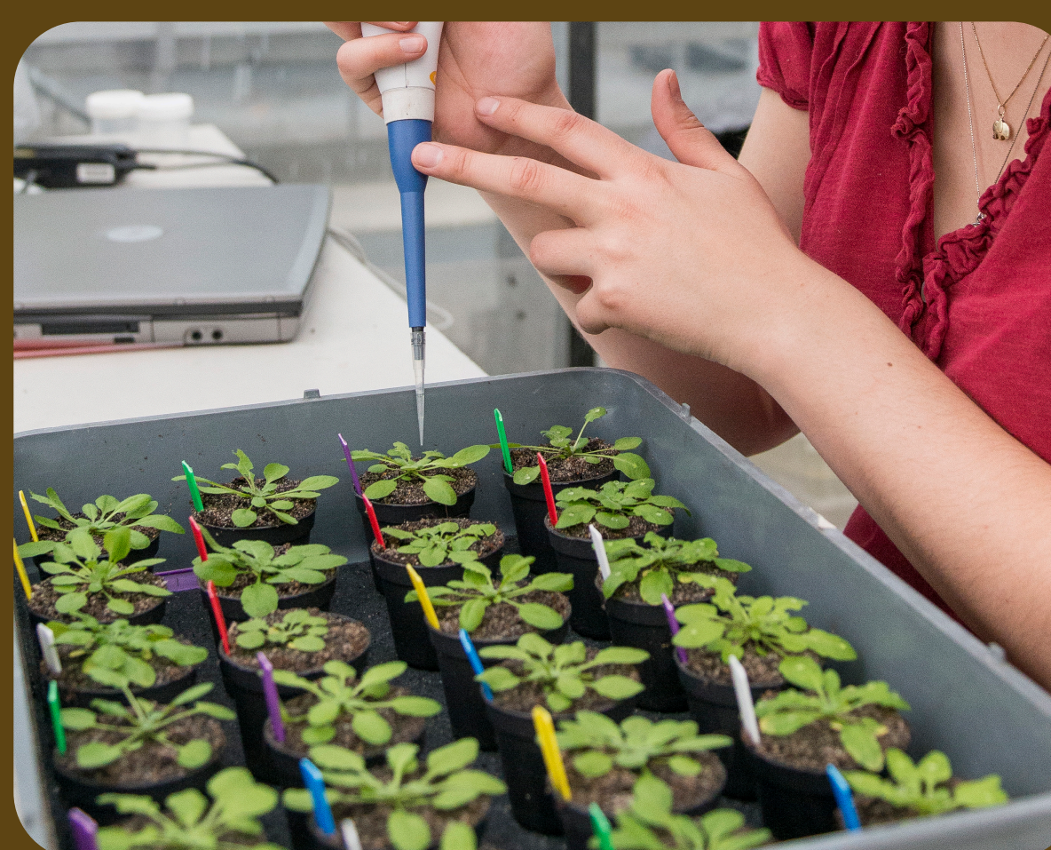
Onderzoek in het lab / Research in the lab

When the plant is under attack by foes, the plant calls in their underground friends for help!