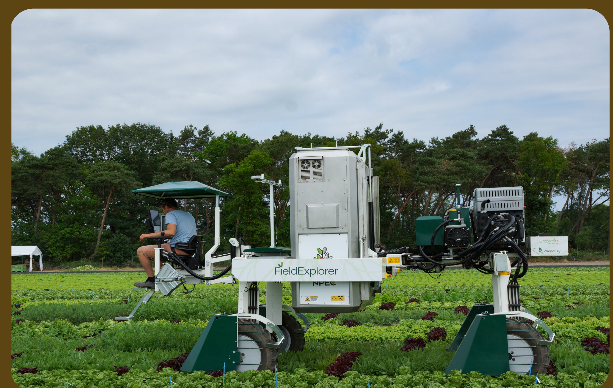
Onderzoek in het veld / Research in the field

We are improving crops so they can combat foes, hold their breath underwater and build walls against drought. Maybe you can help us in the future!