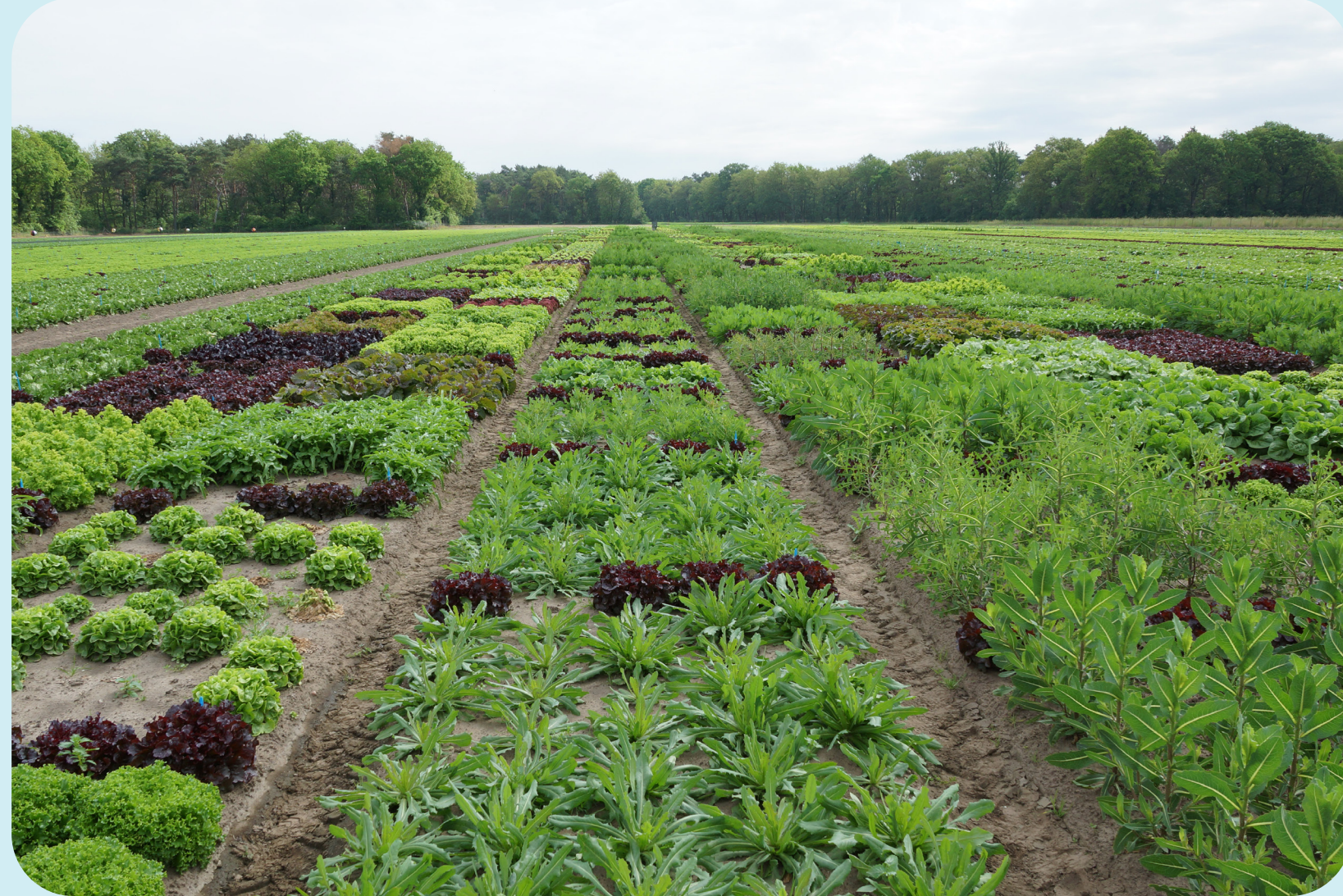
Sla in het veld / Lettuce in the field

Door klimaatverandering hebben onze groenten en fruit het extra zwaar. Onze gewassen zijn goed in groente en fruit produceren, maar niet in zichzelf verweren tegen vijanden en droogte.